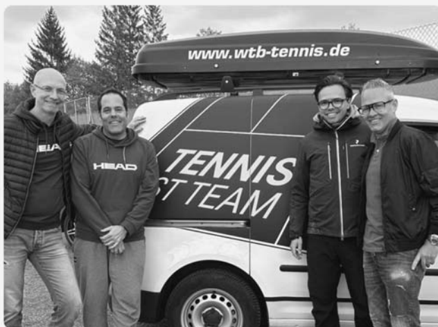
Das WTB Tennis Spielmobil besuchte die Tennisabteilung