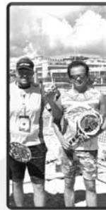
Foto: O. Munz/TC Griesheim Quelle: https://www.itftennis.com/en/rankings/beach-tennis-tour-rankings/