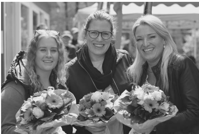
Unser Eventteam 2023

Insgesamt war die Saisoneröffnung der Tennisabteilung des TSV Betzingen ein voller Erfolg. Die Gäste genossen das tolle Wetter, die guten Tennisbedingungen und die angenehme Atmosphäre auf der Tennisanlage. Wir freuen uns auf eine tolle Saison!" Text/Bilder M. Singer