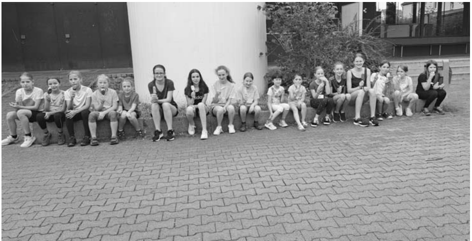
Die Dienstags Rope-Skipper beim Abkühlen mit einem Eis vor den Sommerferien