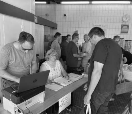
Andrang schon am Freitagabend