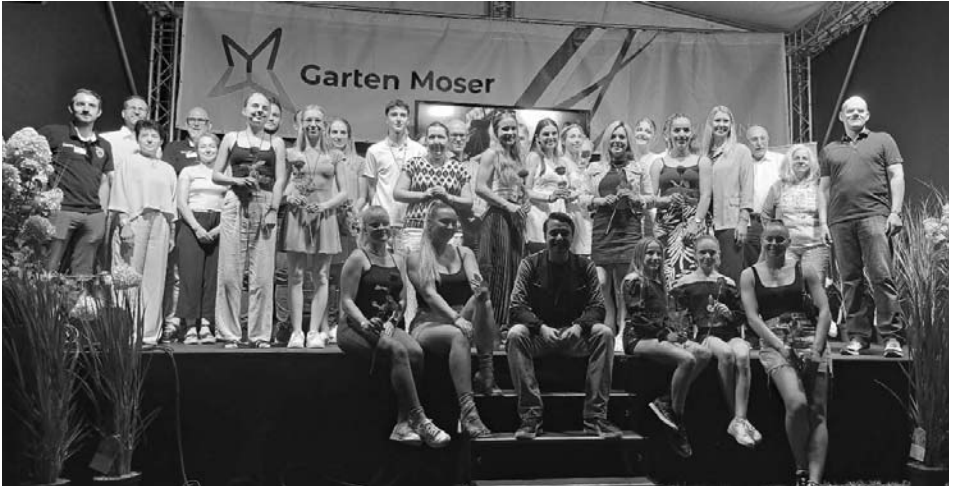
Abschlussbild der Geehrten

Herzliche Gratulation zum tollen Erfolg!