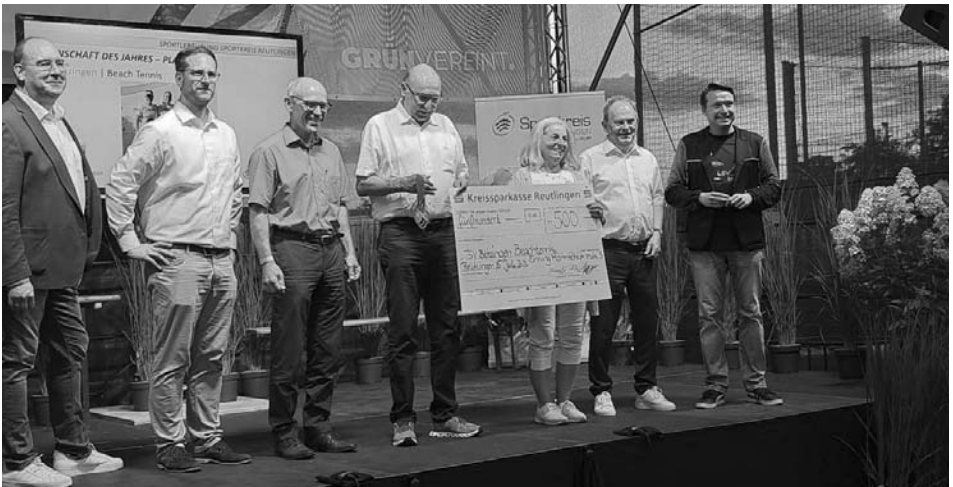
Medaillen und Preisgeld für die Beachtennis-Mannschaft